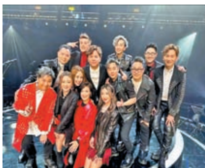
◆《中年好声音》的唱將。

一個普通人能圓歌星夢，真箇發夢也不敢想。 另外，龍婷先聲奪人，將於5月28日聯同香港青年愛樂樂團，在香港文化中心舉行「星夢交響慈善音樂會」，門票價格跟李克勤紅館騷一樣，引起議論，其實龍婷本身大有來頭，她2019年參加央視歌唱節目獲得總冠軍一炮而紅，在2020年《春晚》更壓軸登台獻唱，不少網民大讚票價物有所值。但如非參加《中年好声音》，她可能成為滄海遺珠。 其他參賽者在決賽前，會否突然出招人氣拉票？其實各參賽者都做到友誼第一、比賽第二，不少更成為好朋友，贏輸都其有風度，評判們各司其職，給的評語很有建設性，節目發放正能量，就像在吶喊：人到中年仍然可以追夢！大台夠影響力，《聲夢傳奇》和《中年好声音》迅速打造出兩代唱將。