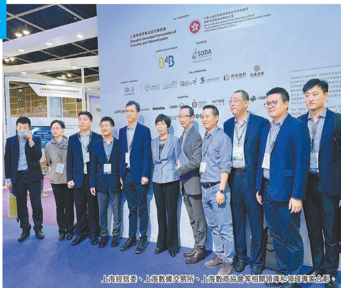
上海經信委、上海數據交易所、上海數商協會等相關領導和領域專家合影。