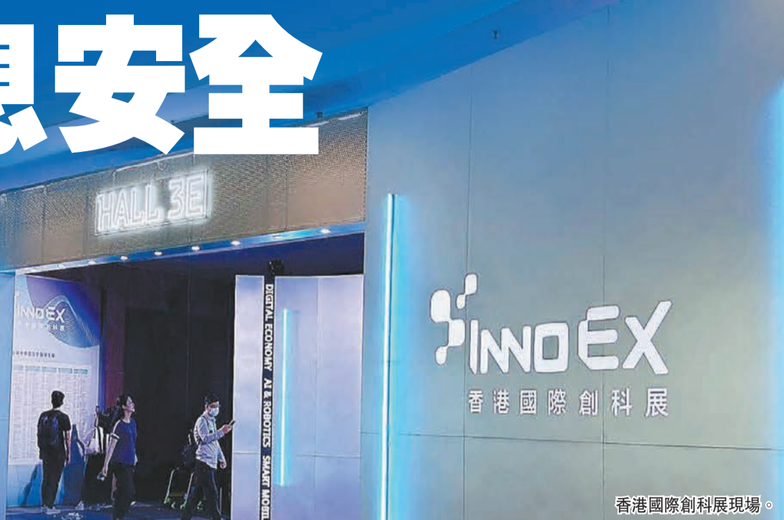
香港國際創科展現場。