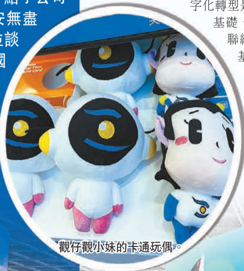
觀仔觀小妹的卡通玩偶。