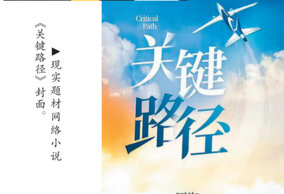
现实题材网络小说《关键路径》封面。