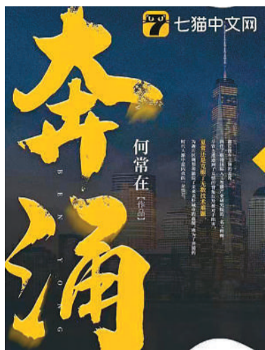
以上海自贸区临港新片区建设为背景，讲述年轻人创业打拼故事。现实题材网络小说《奔涌》。