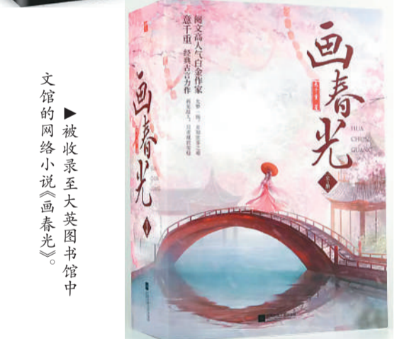
被收录至大英图书馆中的网络小说《画春光》。