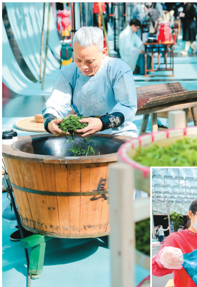
▲“婺州举岩”制作技艺传承人现场展示炒茶。 ▲观众正在现场学习、体验非遗技艺。

日前，浙江省台州市仙居县迎晖幼儿园举行“百米画卷绘春光”活动，小朋友们在老师的指导下将自己心中的春天通过五彩画笔展现出来，抒发对大自然的热爱之情。