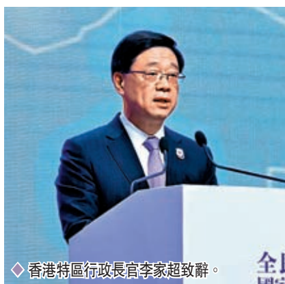
◆香港特區行政長官李家超致辭。

香港文匯報訊（記者 藍松山）香港特區維護國家安全委員會主席、特區行政長官李家超在「全民國家安全教育日2023」開幕典禮上的致辭表示，絕不能低估香港可能出現危害國家安全的風險，必須增強憂患意識，堅持底線思維，做到居安思危、未雨綢繆，隨時準備面對風高浪急的考驗。特區政府會盡早完成基本法第二十三條的立法工作，並正就規管網絡安全、虛假信息和單籌活動等積極進行研究，同時會致力防範化解重大經濟金融風險、完善監管，確保金融安全。