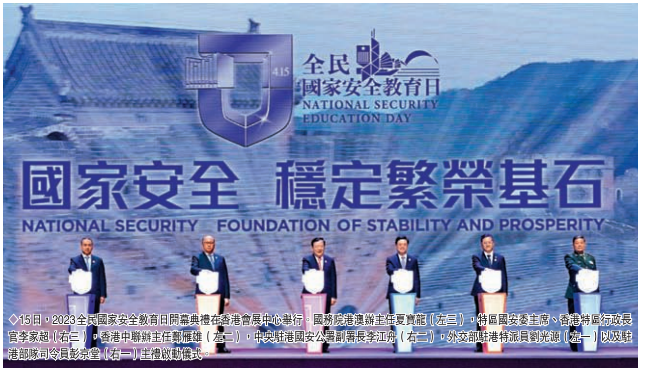
◆15日，2023全民國家安全教育日開幕典禮在香港會展中心舉行。國務院港澳辦主任夏寶龍（左三），特區國安委主席、香港特區行政長官李家超（右二），香港中聯辦主任鄭雁雄（左二），中央駐港國安公署副署長李江舟（右三），外交部駐港特派員劉光源（左一）以及駐港部隊司令員彭宗堂（右一）主禮啟動儀式。

夏寶龍表示，去年7月1日在香港回歸祖國25周年之際，習近平主席視察香港發表一系列重要講話，對香港提出了殷切希望，語重心長地指出「香港是全體居民的共同家園，家和萬事興。經歷了風風雨雨，大家痛感香港不能亂也亂不起，更深感香港發展不能再耽擱，要排除一切干擾聚精會神謀發展」。習近平主席的講話飽含着對香港、對香港同胞的深情關懷，極大增強了全體港人共同守護香港安寧、共創香港美好未來的信心和決心，為維護國家安全、推進「一國兩制」實踐行穩致遠指明了前進方向。