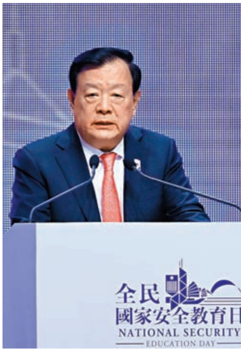
◆國務院港澳辦主任夏寶龍致辭。

香港文匯報訊 據國務院港澳事務辦公室網站訊，香港特別行政區維護國家安全委員會主辦的「全民國家安全教育日2023」開幕典禮15日在香港舉行，國務院港澳事務辦公室主任夏寶龍出席開幕典禮並致辭。