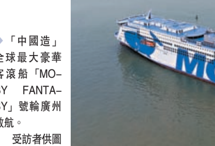
全球最大豪華客滾船「MOBY FANTASY」號輪廣州啟航。

電纜首尾相連有近1,000公里長，約相當於從廣州到重慶的距離。同時，該船內裝方面已實現從設計、製造、安裝全過程的100%國產化。而該船超過70,000噸，是目前建成的全球最大噸位的豪華客滾船。