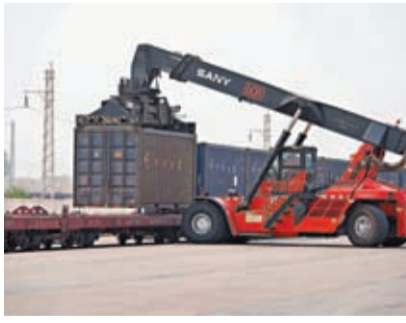
4月15日，中老鐵路公司的員工在老撾萬象南站裝運貨物。新華社

香港文匯報訊 據新華社報道，隨著近日中老鐵路國際旅客列車成功開行，中老鐵路首次實現單日客貨運量雙破「萬」目標。