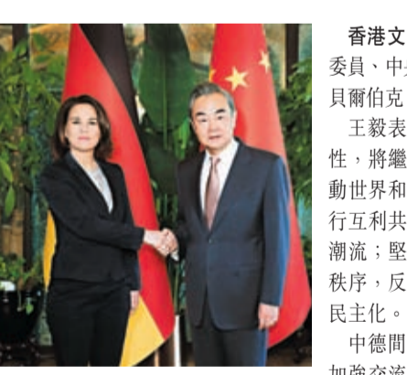
4月15日，中共中央政治局委員、中央外辦主任王毅在北京會見德國外長貝爾伯克。新華社

香港文匯報訊 據新華社報道，中共中央政治局委員、中央外辦主任王毅15日在北京會見德國外長貝爾伯克。