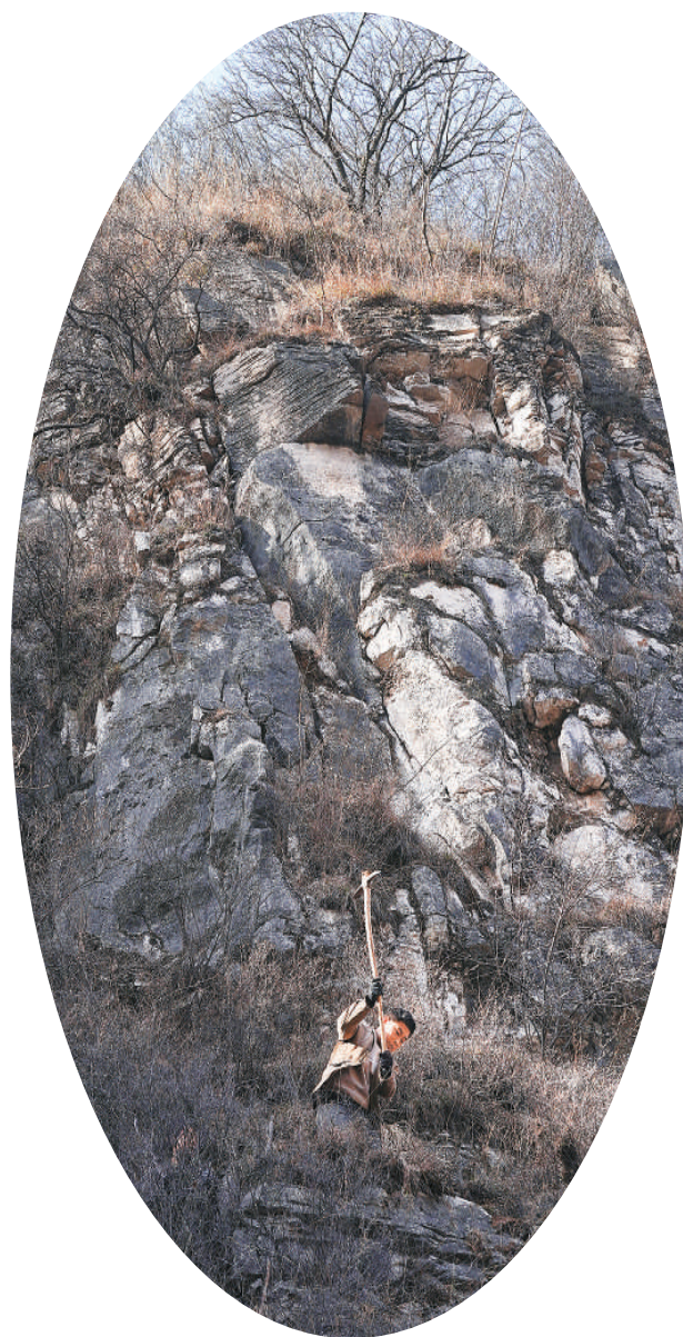
▲ 青龙峡村村民申森在清理路基上的杂物。 ▶ 村民挑着石块运往修路现场。 ▼ 村民在修路间隙歇脚休息，补充体力。