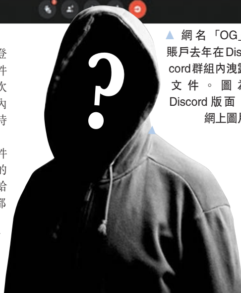
▲ 網名「OG」賬戶去年在Discord群組內洩露文件。圖為Discord版面。 網上圖片

受訪者最後批評稱，對外洩文件中揭露美政府長期監聽外國盟友的行徑感到憤怒，也希望情報機構給美國民眾一個交代。兩名受訪者都堅稱，在OG被捕或逃離美國前，他們絕不會向執法部門披露對方的身份或地址，「即使要冒着失去自由的風險也是如此，他就是我最好的朋友。」