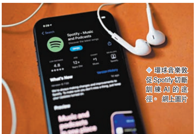
◆ 環球音樂敦促Spotify切斷訓練AI的途徑。

香港文匯報訊 人工智能（AI）發展步伐急速，影響不少創意工業。據《金融時報》報道，音樂巨頭環球音樂集團已展開行動對抗AI，包括刪除AI生成的侵權歌曲，並禁止AI獲取集團的音樂數據。