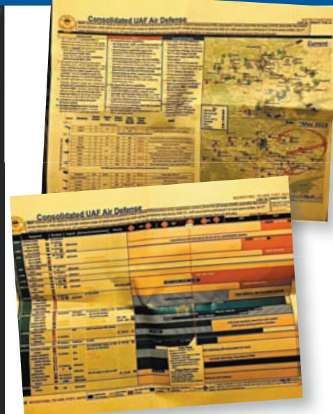
▲ 網上流傳多張疑是密件的相片。

今次外洩的文件最早在遊戲玩家同儕內流傳，當中約有20名成員，其中半數自稱來自美國以外的國家。《華盛頓郵報》訪問到該群組兩名前成員，他們以網名「OG」稱呼洩密者，透露該伺服器是在疫情期間開設，成員都是槍械及軍備愛好者。OG去年就在群組內洩露機密文件，當時他用文字配合註釋方便成員理解，例如「NOFORN」的標籤，即意味「不能與其他國家分享」。