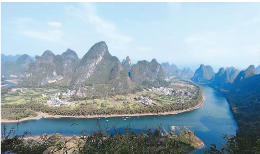
广西桂林阳朔县葡萄镇仙人台。