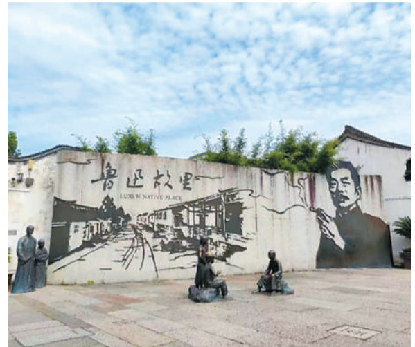
浙江绍兴鲁迅故里。

充满鲁迅童年回忆的《从百草园到三味书屋》是我印象最深的文章，因为文中这段对百草园的描写使我一直以来对他笔下这个儿时的美好“乐园”十分向往。亲眼所见，心情十分激动。