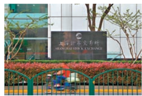
◆滬指12日收報3,327點，漲13點。資料圖片

遊戲板塊、文化傳媒板塊繼續領漲，前者漲逾6%，個股掀漲停潮。長江證券分析，阿里大模型周三揭曉，騰訊等大廠的大模型產品亦有望於今年內面世，加上近期多款融合AI的遊戲產品備受矚目，「遊戲+AI」賽道發展提速。AI技術應用有望提升遊戲行業的研發效率、產品質量與廠商競爭力，開闢行業新增長曲線，遊戲行業全年行情看好。對比之下，釀酒、食品飲料、旅遊酒店等大消費板塊12日走勢黯淡。貴州茅台跌近3%，報1,694元，跌破1,700元關口，創年內新低。