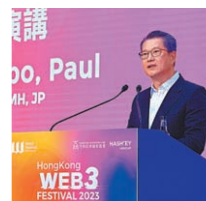
◆陳茂波表示，推動Web3發展的前提，是不能損害到金融體系的穩定和投資者保護。

香港文匯報訊（記者 岑健樂）ZA Bank 12日發表最新發展藍圖，銳意成為Web3生態圈的首選銀行夥伴，為Web3企業提供基本銀行服務。ZA Bank已經具備為香港受監管Web3機構擔任結算銀行的能力，有能力協助如Hash Blockchain Limited等的持牌虛擬資產交易平台（VATP）及時處理和結算交易，近日開始向來自Web3社群的香港中小企或初創企業提供線上開戶服務。ZA Bank行政總裁姚文松表示，隨着香港積極為Web3創造有利環境，ZA Bank把握時機向Web3初創企業提供線上開戶，為傳統銀行服務與Web3世界的融合踏出重要一步。並希望鼓勵其他金融機構仿效，為Web3公司提供貼身的銀行服務。