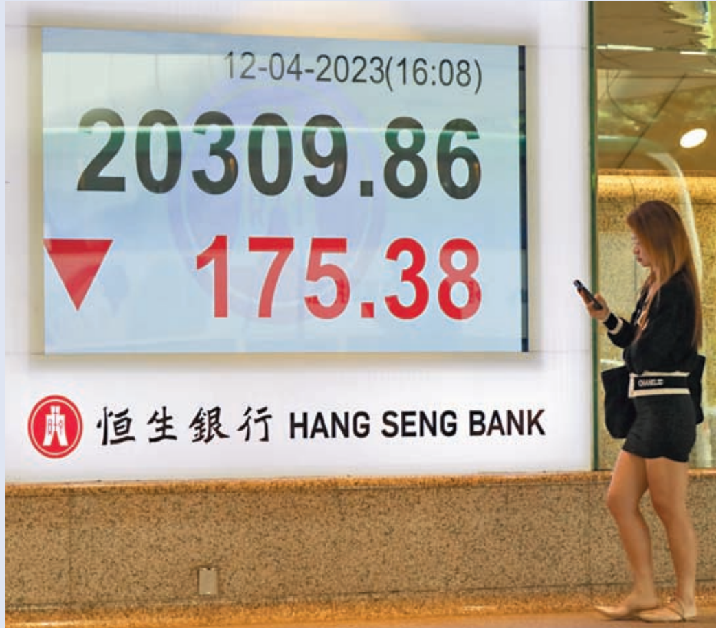
◆恒生指數12日收市報20,309.86點，下跌175.38點。騰訊大跌5.2%，收報357.2港元，是跌幅最大的藍籌股。