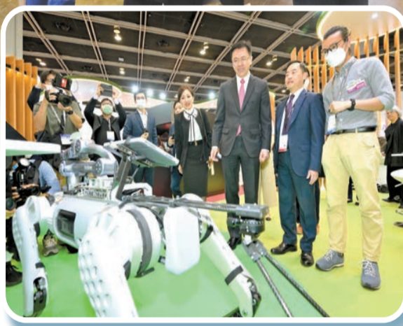
孫東（右三）昨日參觀香港國際創科展智慧香港展館，聽取有關環境保護署「探地雷達機械狗」的介紹。政府新聞處

【香港商報訊】記者王丹丹、姚一鶴報道：從昨日起，特區政府與香港貿發局一連四日在香港會展中心舉辦首屆香港國際創科展。本次展覽與春季電子產品展、國際春季燈飾展一同展開，合共吸引來自20個國家和地區的逾2900家展商參與。政府資訊科技總監辦公室設置了智慧香港展館，展出逾百項與市民生活息息相關的科技方案，透過互動體驗及即場示範，展示各界努力推動香港創科及智慧城市發展的成果。