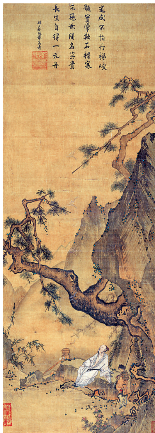
▲松寿图 马远（南宋） 辽宁省博物馆藏