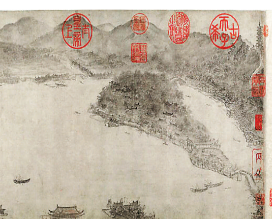
▲西湖图（局部） 李嵩（南宋）

“夜山钩古”以个案研究的方式，呈现20世纪中国传统书画艺术的集大成者——黄宾虹，如何以自身艺术实践和学术研究来传承宋韵，泽被后世。展览以“小切