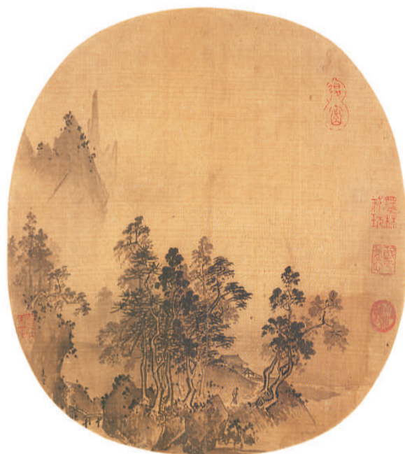
▲烟岫林居图 夏圭（南宋） 故宫博物院藏