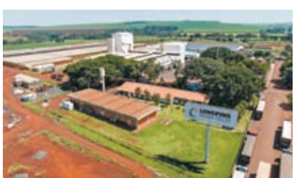
這是3月25日在巴西聖保羅州拍攝的隆平巴西研發中心與種子工廠。新華社

香港文匯報訊 綜合新華社及中新社報道，經雙方商定，巴西聯邦共和國總統盧拉將於4月12日至15日對中國進行國事訪問。外交部發言人汪文斌11日在例行記者會上回答有關提問時