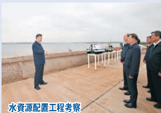
水資源配置工程考察