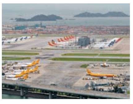
香港國際機場在2022年再度成為全球最繁忙貨運機場。

機管局公布，多項發展項目現正全面推進以提升空運服務，敦豪中亞區樞紐中心擴建工程，已於2023年第一季完成並可作營運，貨物處理能力增加50%；由阿里巴巴集團旗下物流公司菜鳥網絡牽頭的合資公司於機場興建高層物流中心，預計於今年竣工；於東莞建設的「香港國際機場物流園」，以及在機場新增的「海空聯運貨運碼頭」，將會引入全新海空貨運模式，其先導計劃已順利展開。