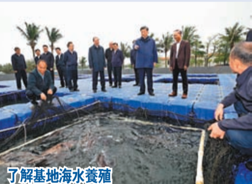
了解基地海水養殖