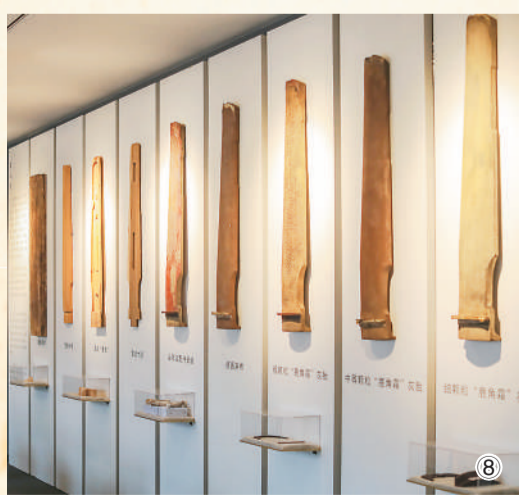
图①②：顾恺之《斫琴图》(局部) 宋人摹本。 图③：故宫博物院藏“九霄环佩”刻字。 图④：陶托琴筒。 图⑤：明代古琴曲《秋鸿》图谱册(局部)。 图⑥：黄玉琴式镇纸。 图⑦：五彩琴鹤随人物因盖罐。 图⑧：故宫博物院首次举办古琴展。 (图①—图⑦均为故宫博物院藏)

从古琴研究到古琴保护，从古琴复制到古谱复活，从古琴演奏到古琴教学，故宫博物院的古琴及其文化正被越来越多的人所了解和认知，鸣响出新时代的大雅正音。