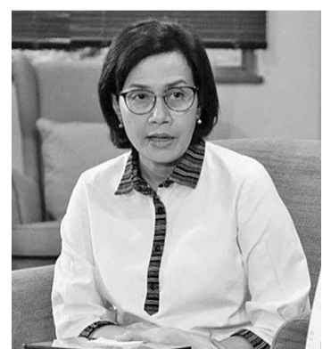
财政部长穆丽亚妮希