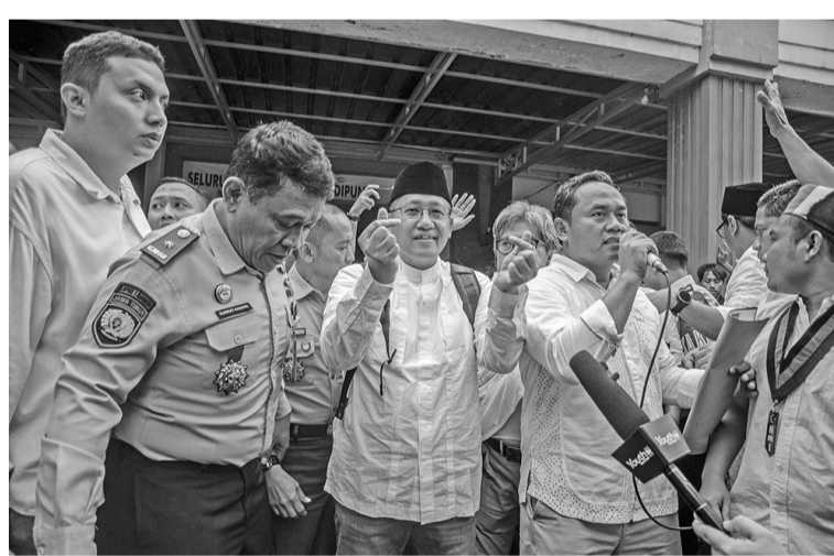
民主党前总主席阿纳斯(右)正式获释