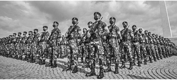
民调显示国军是公众最信任的机构

【本报讯】最近的LSI调查结果显示，国军是公众最信任的机构，国军获得的公众信任度，从非常信任的28%起，至相当信任的63%。公众信任的第二个国家单元是总统，公众对总统的强烈信任度为21%，而适度信任度为63%。