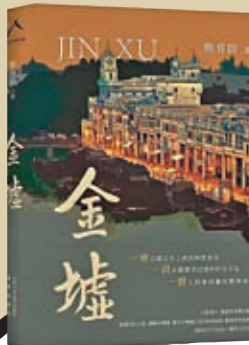
◆《金墟》以赤坎古鎮在民國時期和新時代的兩次城鎮建設為線索，雙線並行，寫出了兩代僑鄉人民的生活與命運、百年古鎮的興衰與悲歡。