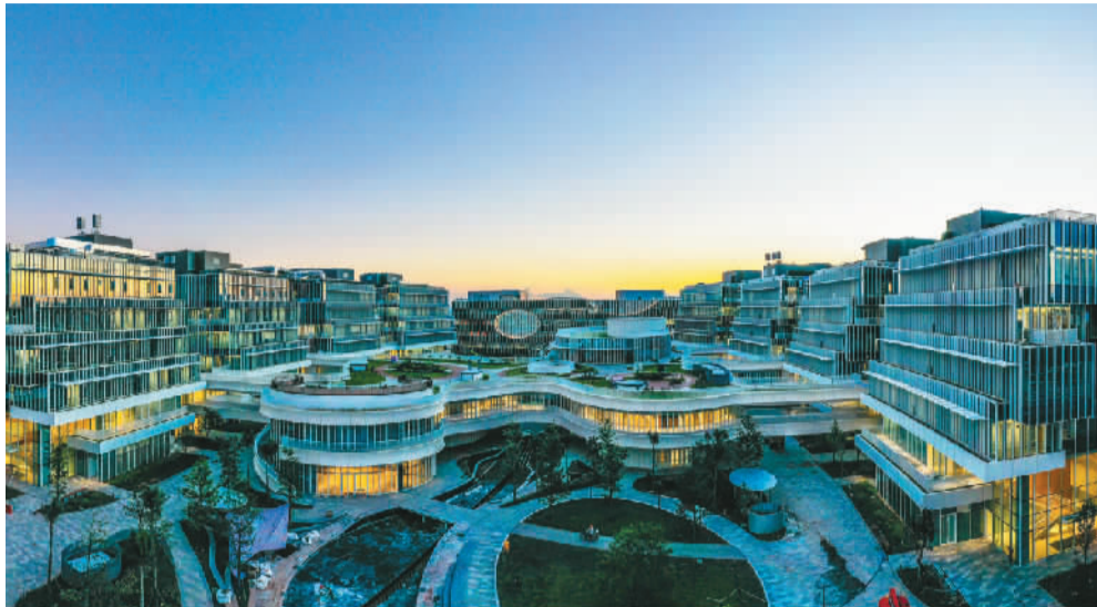
位于广州南沙的香港科技大学(广州)校园。

近年来，内地与港澳高校交流合作日趋紧密，参与范围更加广泛，内容与形式更为多元。在各方的共同努力下，内地与港澳高校之间积极推动优势互补，努力实现资源共享，合作效应加乘。