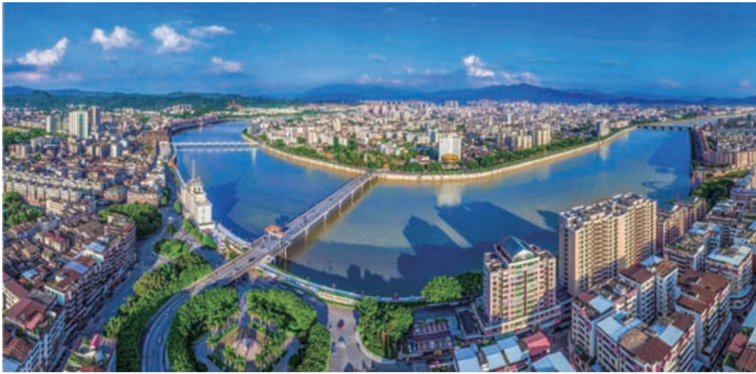
梅州城區全景

本報訊(記者黃科)日前,中共梅州市委、梅州市人民政府印發《梅州市對接融入粵港澳大灣區加快振興發展實施方案》(下稱《方案》),提出圍繞國家賦予梅州的“一區兩城”戰略定位,深入推進蘇區振興、融灣入海“兩大戰略”,大力實施“六大工程”,推動梅州蘇區融灣發展不斷邁出新步伐、取得新成效。