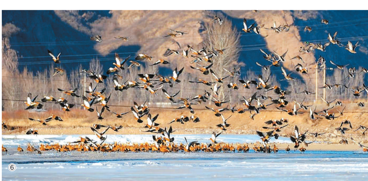
图①：养殖户在养殖小区拴牛。