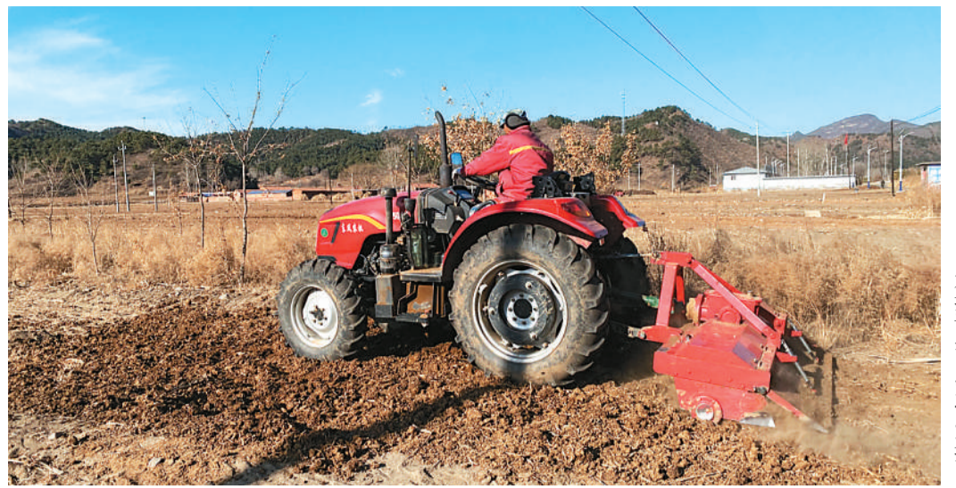
北山根村村民使用机器翻地。