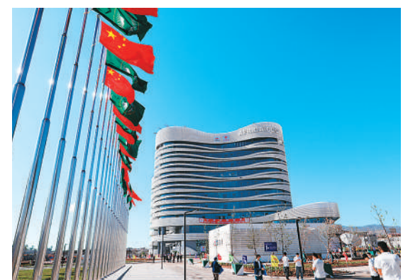
1月11日,埃塞俄比亚首都亚的斯亚贝巴,由中国援建的非洲疾控中心总部项目举行竣工仪式。