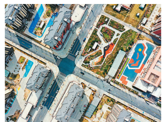
雄安新区容西片区内的街道和公园(2023年3月31日摄,无人机照片)。