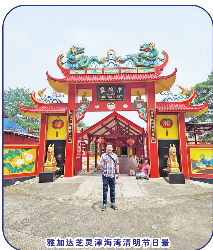
雅加达芝灵津海湾清明节日景

【本报讯】今年2023年是万隆华裔家属疫情后最高兴的举办清明节祭祖庆拜祖先的孝道精神传承给后代的日子。