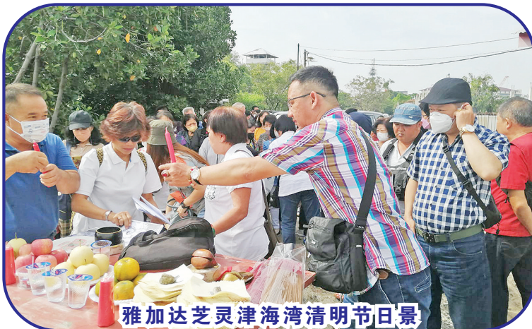
雅加达芝灵津海湾清明节日景