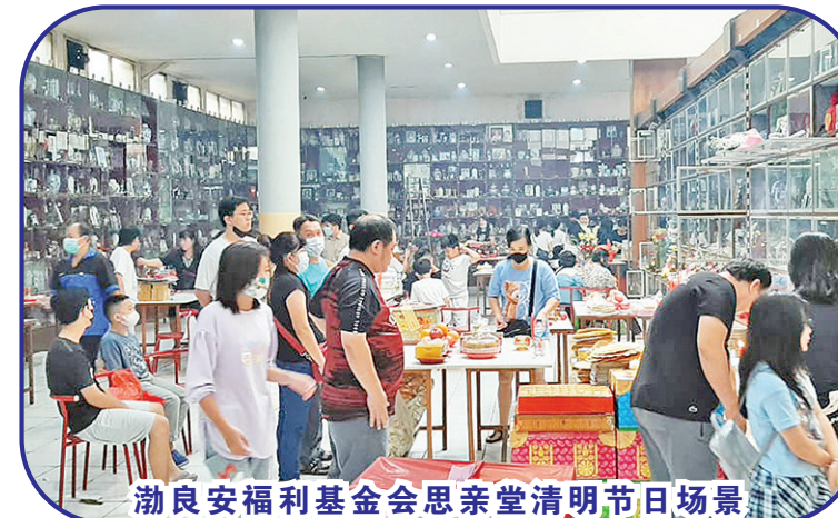
渤良安福利基金会思亲堂清明节日场景