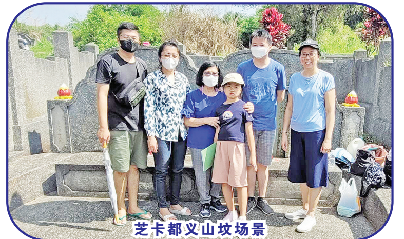
芝卡都义山坟场景