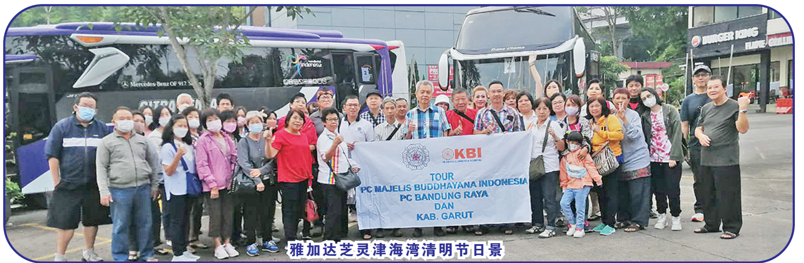
雅加达芝灵津海湾清明节日景

卡都坟场，规模大有几座山地坟场，风景好，风水好，70年代有好几位万隆著名企业家的坟地，建筑风格模仿古代皇族家庭坟园，当时成为万隆华人群里乐于讲述的时事。