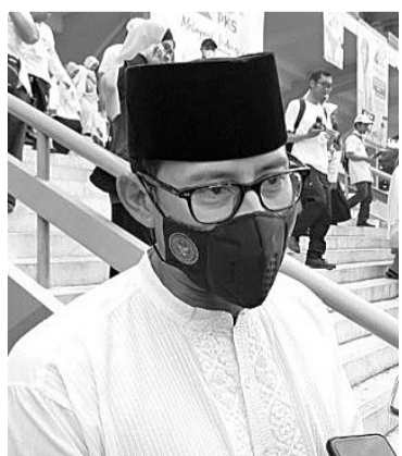
旅游业与创意经济部长善迪亚卡

【本报讯】旅游业与创意经济部长善迪亚卡于4月8日在勿加西县芝卡朗 (Cikarang) 与公正福利党总主席夏宇库 (Ahmad Syaikh) 会晤时表示，仍在等待普拉波沃关于其