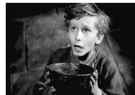
◆大導演大衛連曾執導氣勢磅礴《沙漠梟雄》、《印度之旅》等偉大電影；新加坡著名作家/畫家吳偉才深有同感，特別喜歡《孤星淚》！

回到主題，還是「孤兒」或「孤星」二字吸引；尤其童年犯錯，被母親體罰，或因學習懶惰受到老師及家人責罵，一眾孤兒故事、電影立刻上身，回自己房間睡床上發一輪孤兒春秋大夢。 吳偉才寫《孤星淚》，與其自身成長過程息息相關，尤其讀過編入他的新書《浮生流影》，曾經獲得1983/84年首屆「聯合報金獅獎」散文組推薦獎的早年作品《我和我的母親》，才比較清楚偉才版本的成長孤星淚。 母親在偉才5個月大，受到丈夫不忠、家姑壓力，咬緊牙關離家出走；雖然在「要仔唔要嘅」祖母悉心照料，祖父深厚的愛護，對一個不知「母親」為何物，直至12歲才首次見到親母的孩童說來，如假包換百分之三百孤星血淚……另加那個風流成性、近乎隱形的父親偶爾加插劇情，何止貼近？濃烈得散不開來孤兒的痛；讀着、讀着偉才近乎時而悲鳴、時而嚎啕大哭的描繪，那抹孤星血淚簡直血跡斑斑，血流成河！