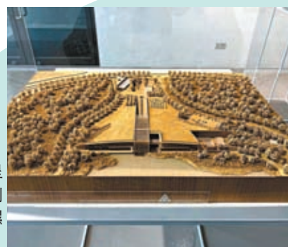
◆展覽呈現等比例縮小的濕地公園。