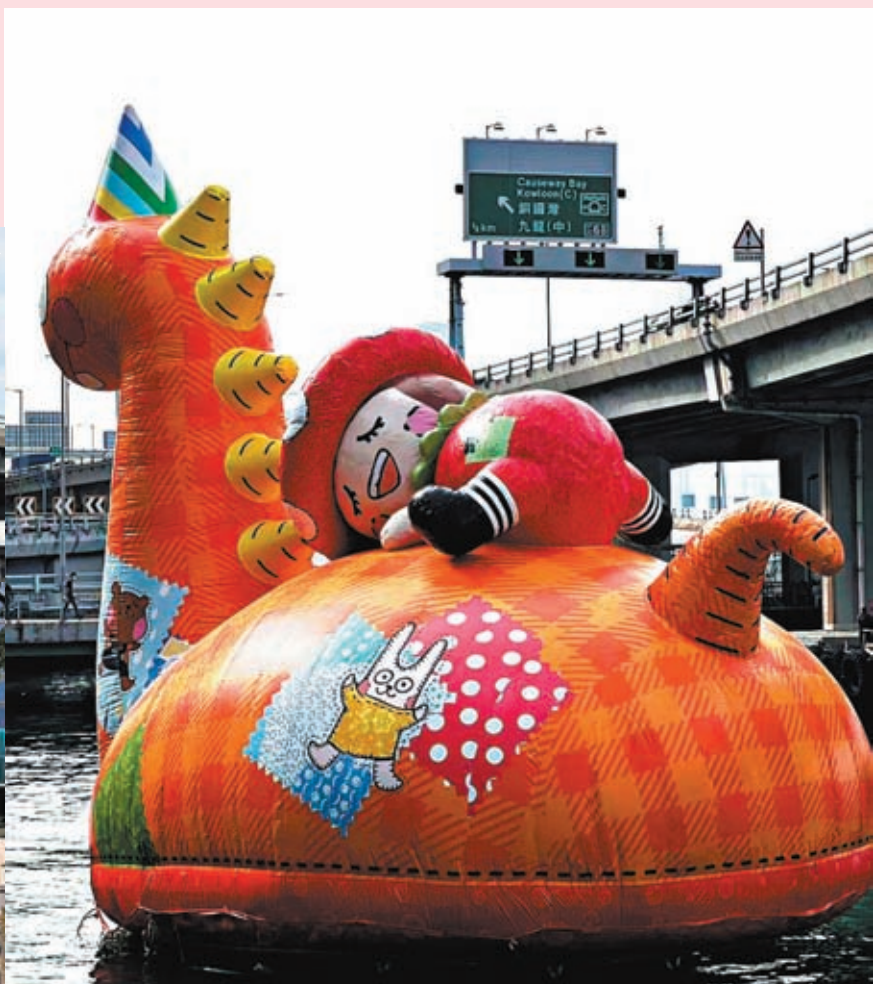
◆巨型東東與法天娜出現在北角碼頭對開海面。