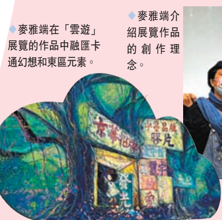
◆麥雅端在「雲遊」展覽的作品中融入卡通幻想和東區元素。