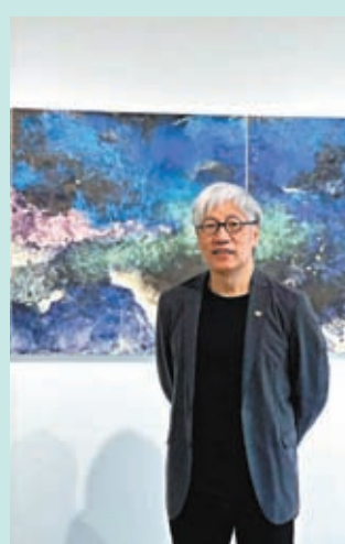
◆馮永基認為目前香港的藝術裝置有很好的發展趨勢。

馮永基在1952年生於香港，是著名的香港建築師和建築師。他的職業生涯始於景觀美化，並相當關注香港的郊野環境，這反映出他對香港本土的深厚感情和歸屬感。近年來，他開始探索更高的普世價值，藉此提高人們對環境和全球社會問題的認知。