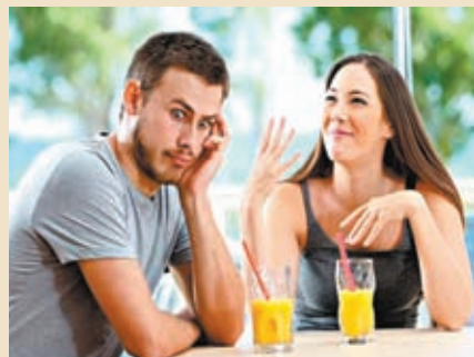
◆約會前利用搜索引擎搜索對象資料，或會受虛假資訊影響。網上圖片

同時，誹謗聲明不僅要證明聊天機械人說的是假話，且要證明它的言論造成了現實世界的傷害，例如代價高昂的名譽損失。這可能需要某人不僅檢查聊天機械人生成言論，更要合理地質疑它並據此採取行動。