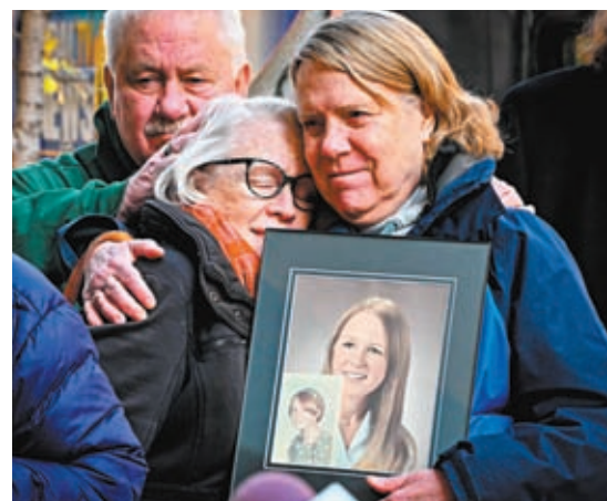
◆倖存者父母向教會報告虐待事件卻無濟於事，去年作出公開抗議。

馬里蘭州司法部長布朗6日發布報告時表示：「今天是馬里蘭州真相揭露和問責的一天」。現任巴爾的摩教區主教洛里公開對報告內容表達遺憾，以及向倖存者致歉。