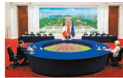
4月6日下午，中國國家主席習近平在北京人民大會堂同法國總統馬克龍、歐盟委員會主席馮德萊恩舉行中法歐三方會晤。