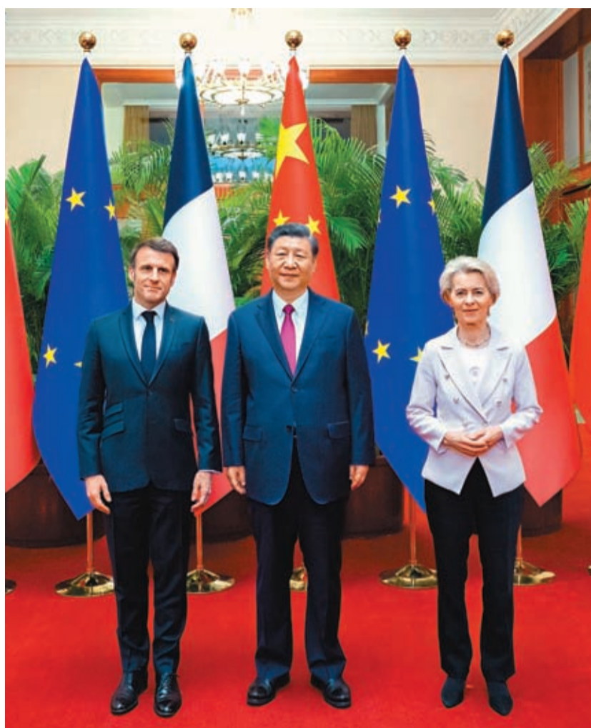
4月6日下午，中國國家主席習近平在北京人民大會堂同法國總統馬克龍、歐盟委員會主席馮德萊恩舉行中法歐三方會晤。