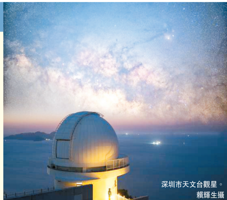
深圳市天文台觀星。

未來，西涌國際暗夜社區將分期完成範圍內所有戶外照明設施的改造工作，在持續改善西涌暗夜環境的基礎上，完善相關配套設施，開展天文科普場館、星空露營地建設，並結合暗夜天文主題，策劃星空夜遊主題巴士、星空音樂節等形式多樣的星空旅遊活動，逐步將大鵬新區全域建設成為星空公園，打造「粵港澳大灣區1小時星空銀河圈」。