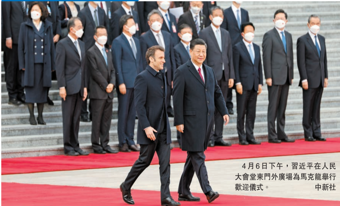
4月6日下午，習近平在人民大會堂東門外廣場為馬克龍舉行歡迎儀式。

【香港商報訊】據新華社消息，4月6日下午，國家主席習近平在人民大會堂同來華進行國事訪問的法國總統馬克龍舉行會談。