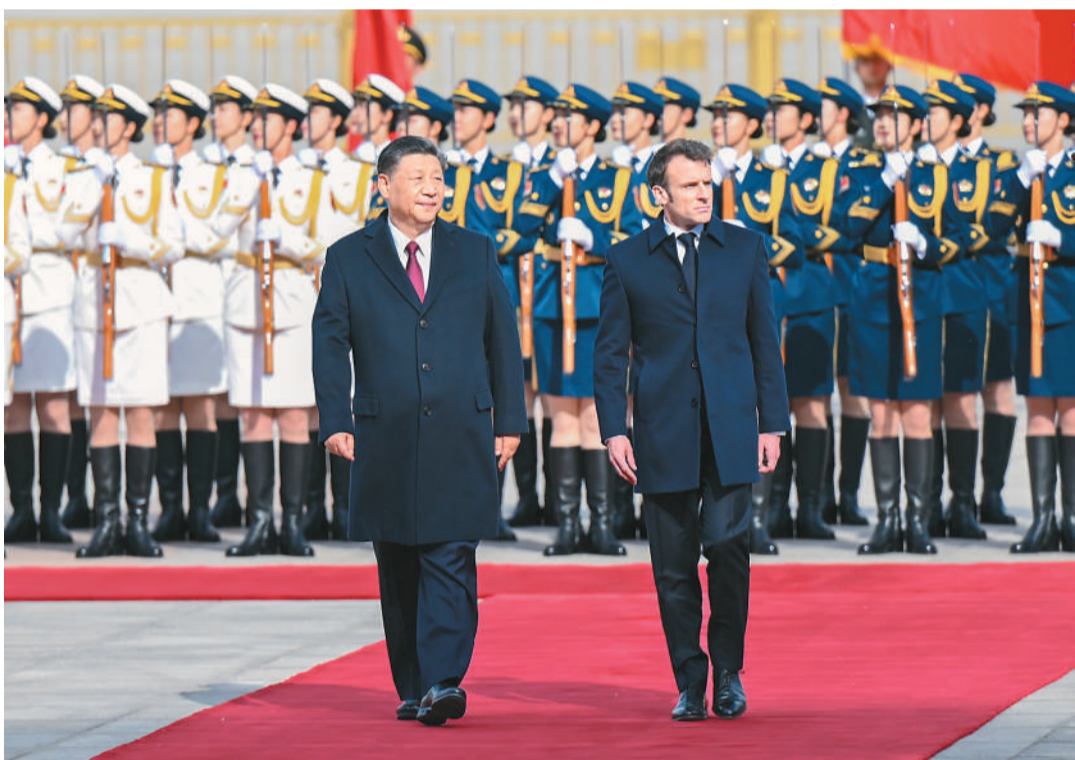
四月六日下午, 国家主席习近平在北京人民大会堂同来华进行国事访问的法国总统马克龙举行会谈。这是会谈前, 习近平在人民大会堂东门外广场为马克龙举行欢迎仪式。