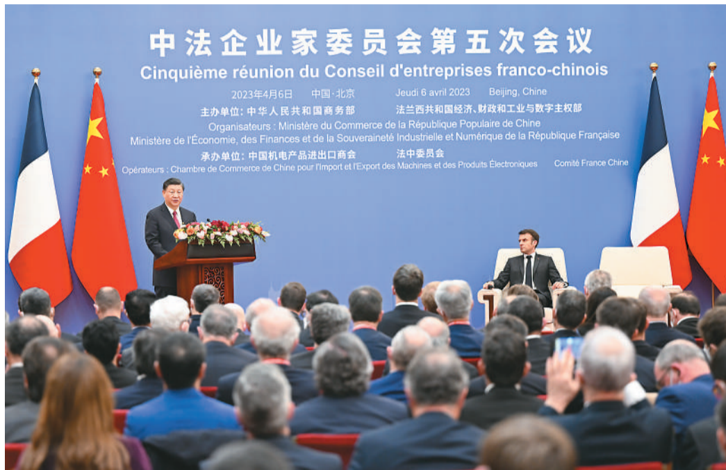
四月六日下午, 国家主席习近平在北京同法国总统马克龙共同出席中法企业家委员会第五次会议闭幕式并致辞。