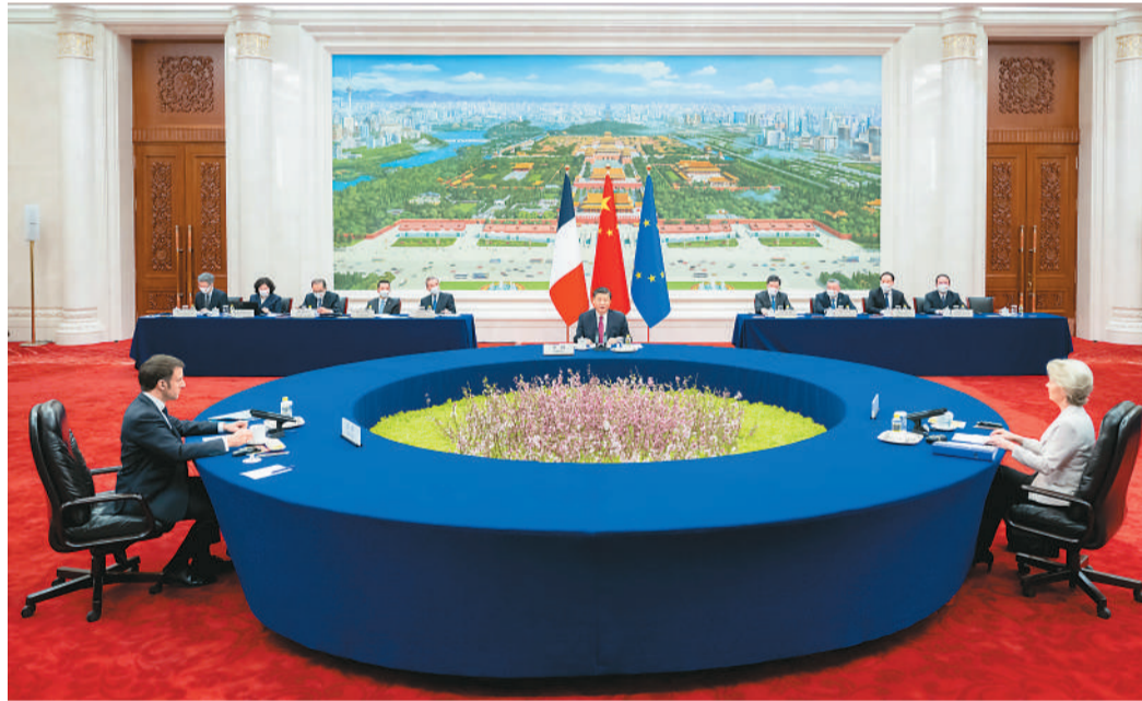
四月六日下午, 国家主席习近平在北京人民大会堂同法国总统马克龙、欧盟委员会主席冯德莱恩举行中法欧三方会晤。