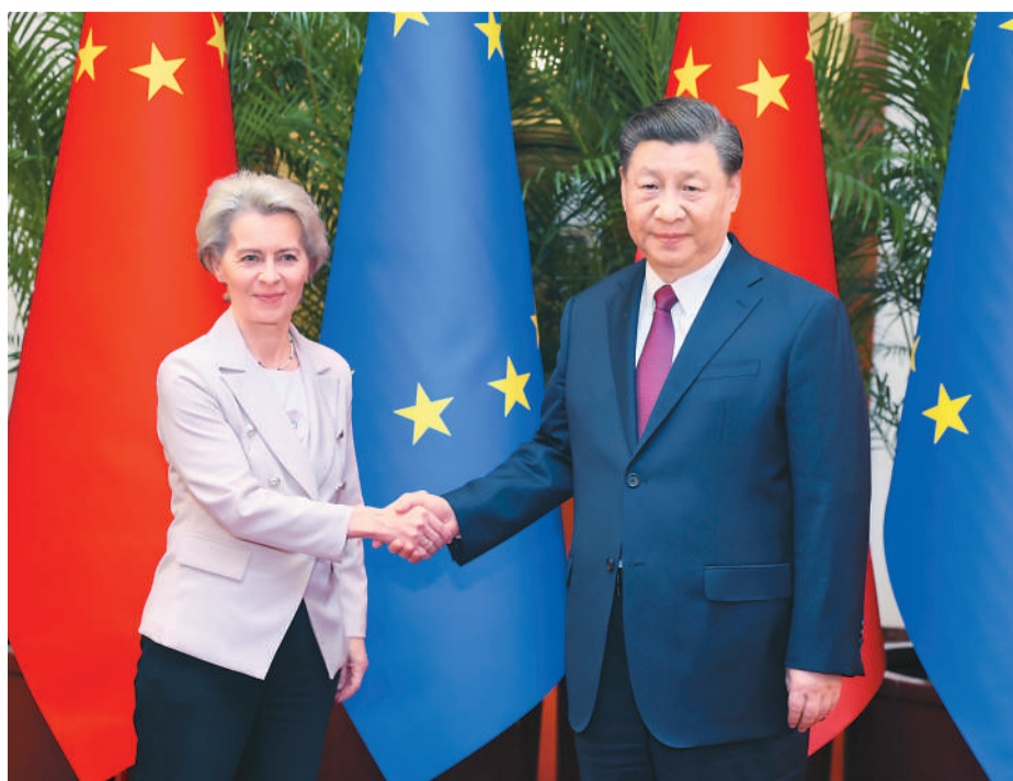
4月6日下午, 国家主席习近平在北京人民大会堂会见欧盟委员会主席冯德莱恩。