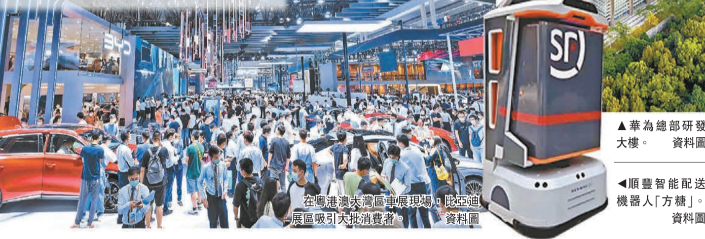
▲華為總部研發大樓。資料圖