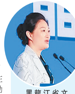
黑龍江省文化和旅遊廳黨組書記、廳長何晶致辭。

何晶在接受媒體採訪時表示，近年來，廣東省深度融入粵港澳大灣區一體化建設，同時，與黑龍江省的對口合作成果顯著。今年，黑龍江又滿載誠意來粵推介夏季旅遊產品，是此前良好合作的延續，也是此後全新合作的起點。通過推介，不僅調動了龍、粵兩地互遊的熱情，還促成了兩省旅遊企業的合作，我們