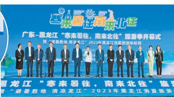
黑龍江省文化和旅遊廳黨組書記、廳長何晶與十三市地文旅局領導共同上台，向廣東省人民發出熱情邀約。

希望通過龍粵兩省的對口合作關係，吸引港澳兩地客源，推動龍粵港澳客源互送，讓更多的企業家、投資者暢遊黑龍江、愛上黑龍江，從而吸引粵港澳大灣區的客商來黑龍江投資興業，讓文化和旅遊產業對經濟增長的拉動作用持續增強。