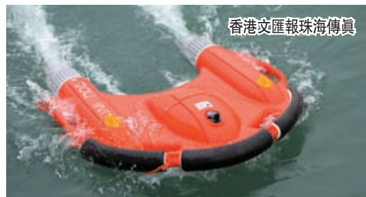
「海豚1號」水面救生機器人