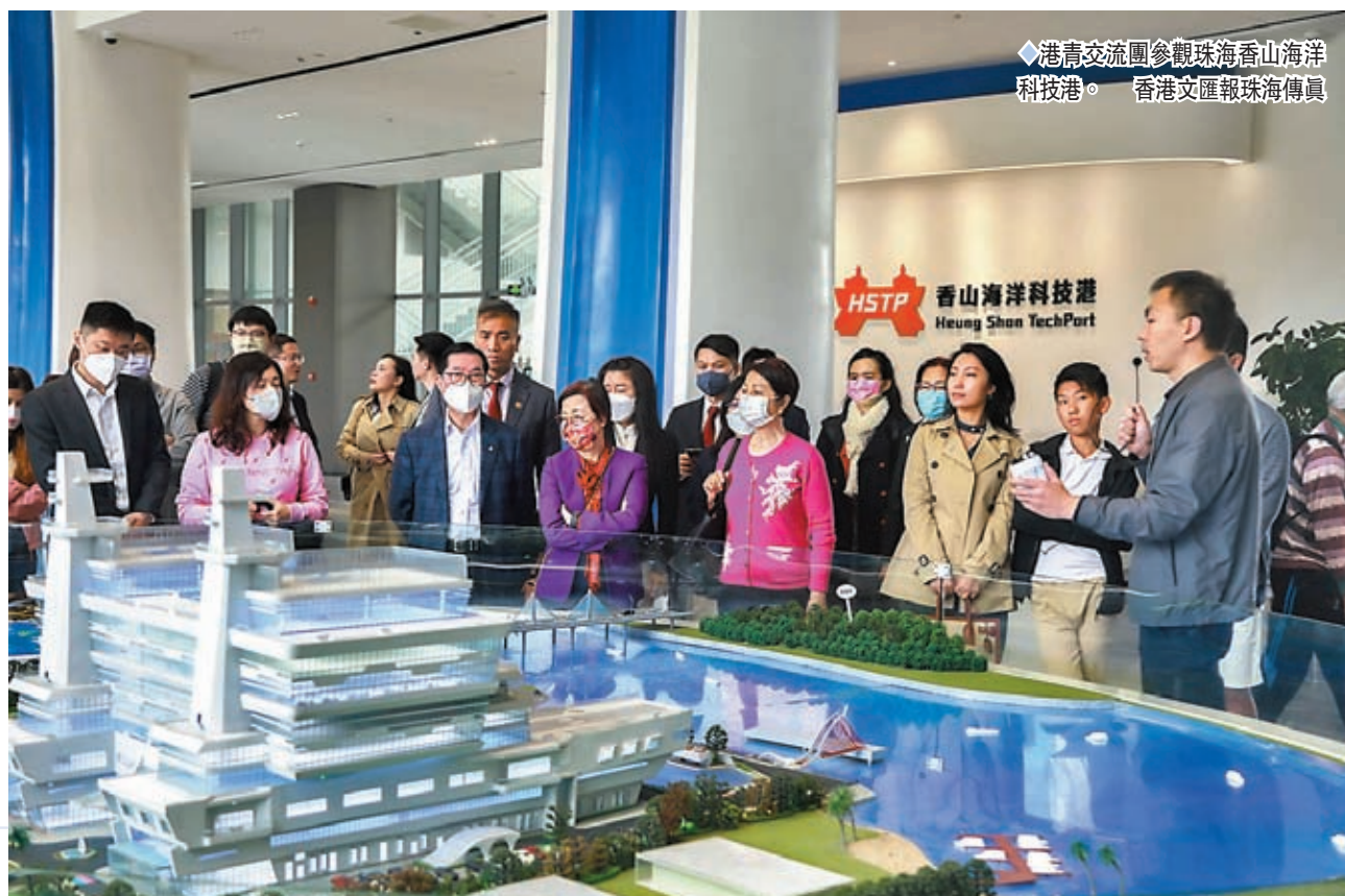
港青交流團參觀珠海香山海洋科技港。香港文匯報珠海傳真

港青交流團一行2日參觀了位於珠海高新區的香山海洋科技港。該科技港是中國首個無人船艇研發測試基地，也是珠海重點建設的「粵港澳海洋科技企業服務平台」，園內配備室內實驗室、測試水池、海上試驗區等共8大類、過百小類測試項目，瞄準前沿海洋裝備產業。