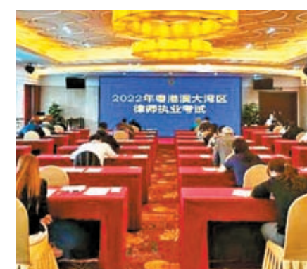
大灣區律師執業資格考試吸引越來越多香港律師到大灣區內地發展。

此次《規劃》，重點內容為加強與港澳等境內外法律服務行業合作。在平台建設方面，廣州將指導把南沙粵港澳大灣區法律服務集聚區打造為以涉外法律服務為主的粵港澳法律服務業全面合作示範區，走平台化、規範化、國際化的發展路徑，融合訴訟、仲裁、公證、司法鑒定等高端法律服務資源。據了解，位於南沙創享灣的粵港澳大灣區法律服務集聚區於2020年啟用，目前，大灣區法律服務集聚區已吸引超過30家法律服務相關機構進駐。在與港澳業界具體合作方面，將完善內地與