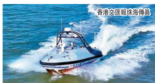
L30「瞭望者」警戒巡邏無人艇