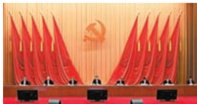
4月3日，學習貫徹習近平新時代中國特色社會主義思想主題教育工作會議在北京召開。習近平、李強、趙樂際、王滬寧、蔡奇、丁薛祥、李希、韓正出席會議。