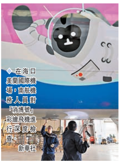
在海口美蘭國際機場，南航機務人員對「消博號」彩繪飛機進行深度檢查。新華社

區市交易團參展，採購商和專業觀眾預計超5萬人。展會期間還將舉辦百餘場論壇研討、成果發布、貿易洽談、投資推介等活動。