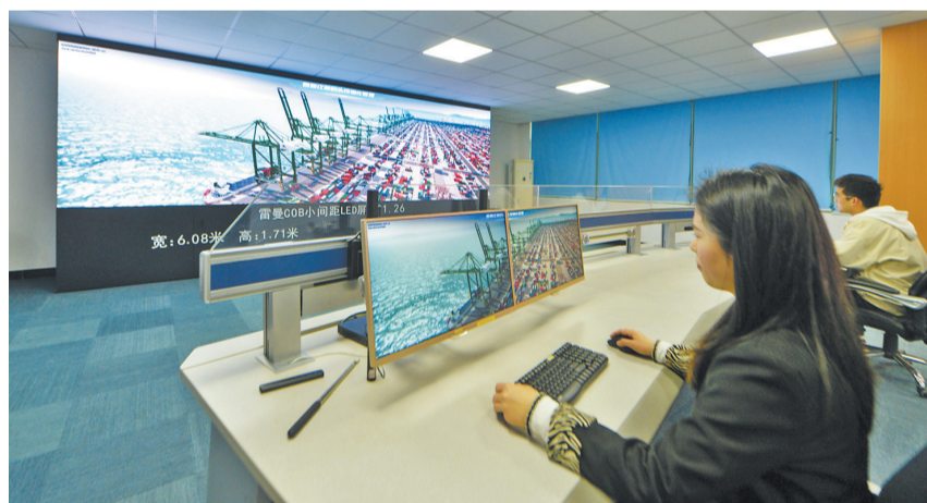
显示屏展示智慧江阴港口可视化管理系统。

软件园,多年来专注于数字孪生可视化领域,坚持技术深耕,致力于提供成熟优质的行业数字孪生IOC整体解决方案,以及CIM数字孪生底座构建服务。作为福州软件园培育的国家高新技术企业,近年来,数字冰雹公司研发的可视化系统遍布福建