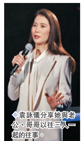
袁詠儀分享她與老公、哥哥以往三人一起的往事。