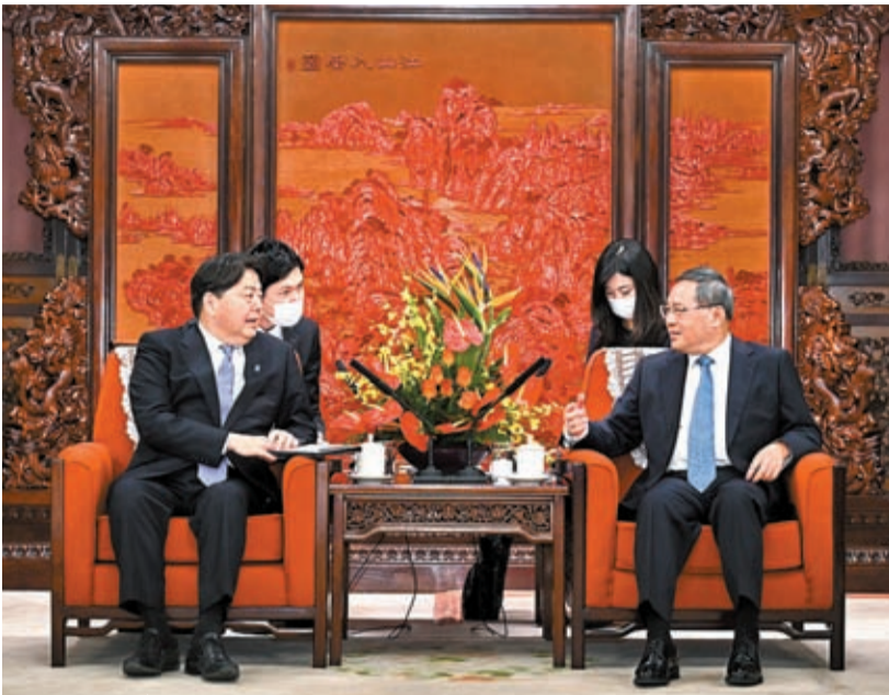
中國國務院總理李強2日在北京南海紫光閣會見來華訪問的日本外相林芳正。

李強指出，歷史、台灣等重大原則問題事關兩國關係政治基礎，應該以誠相待、以信相交、妥善處之。中日作為重要經貿夥伴，在實現各自發展方面相互促進、彼此成就，利益深度融合。雙方應該也完全可以做大經貿合作的蛋糕，在數字經濟、綠色發展、財政金融、醫療養老等方面加