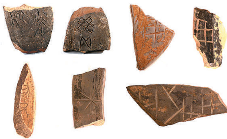
陕西旬邑西头遗址出土的陶器刻划符号与陶文。

西头遗址位于陕西省咸阳市旬邑县张洪镇原底社区西约1千米西头村，地处泾河东岸台塬边缘地带。发现仰韶、龙山、先周、西周、汉唐等各时期遗存，出土陶器、铜器、骨器、石器千余件。