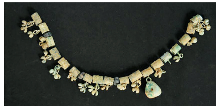
大松山墓群出土的铜串饰（明）。

大松山墓群位于贵州省贵安新区马场镇。2022年7月至2023年1月，贵州省文物考古研究所等单位对该墓群开展了全面考古发掘，共清理墓葬2192座，出土各类文物4000余件（套）。