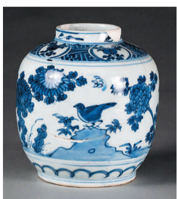
河南开封州桥及附近汴河遗址出土的晚明时期景德镇青花花卉纹罐。

州桥遗址的考古发掘，对于研究北宋东京城的城市布局结构具有重大意义，其考古发掘还原了大运河及东京城繁荣的宏大历史场景，为我国古代桥梁建筑技术等研究提供了新的