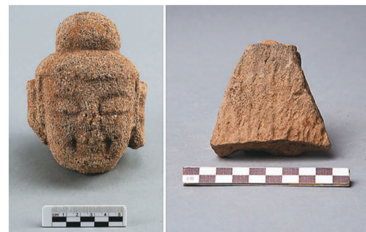
吉林琿春古城村2号寺庙址台基夯土出土遗物。