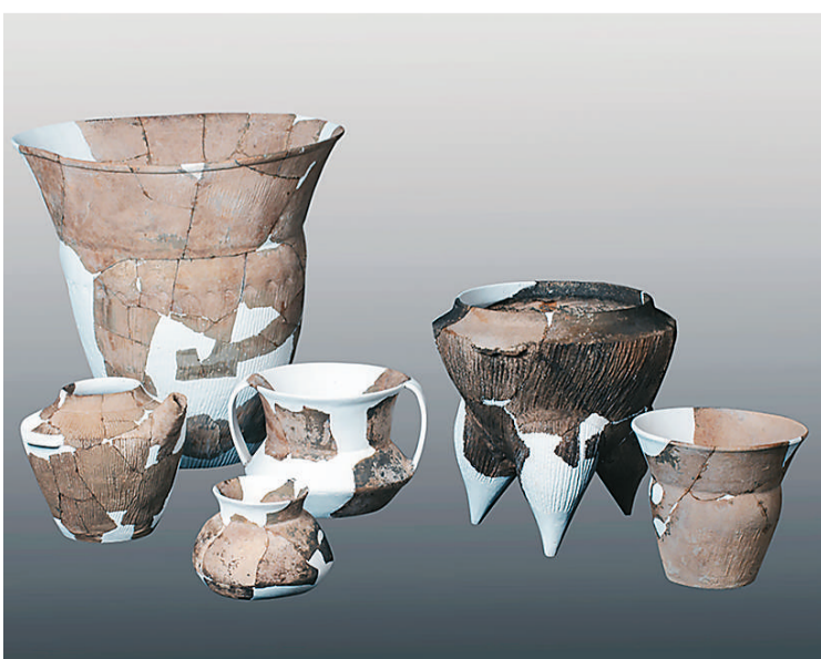
山西兴县碧村遗址瓮城内出土的陶器（东城门）。

碧村遗址是晋陕大峡谷东岸发现的规模最大的一座史前石城，与同期盛极一时的石峁古国遥相呼应。该遗址占据河套石城文化圈向中原过渡的前沿要地，是展现以中原为中心的中华多元一体文明形成轨迹的重要窗口。