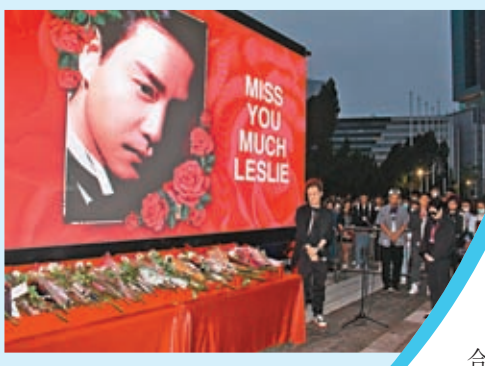
4月1日晚6點43分，陳太與現場歌迷靜默一分鐘來懷念哥哥。