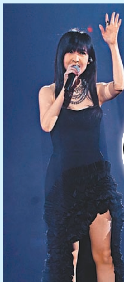
周慧敏唱出哥哥當年寫給她的歌曲《如果你知我苦衷》。