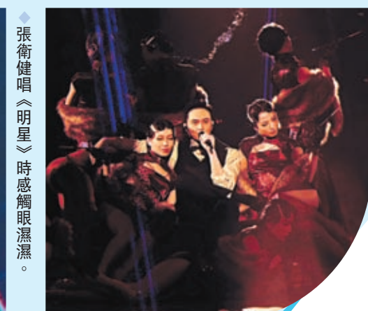
張衛健唱《明星》時感觸眼濕濕。