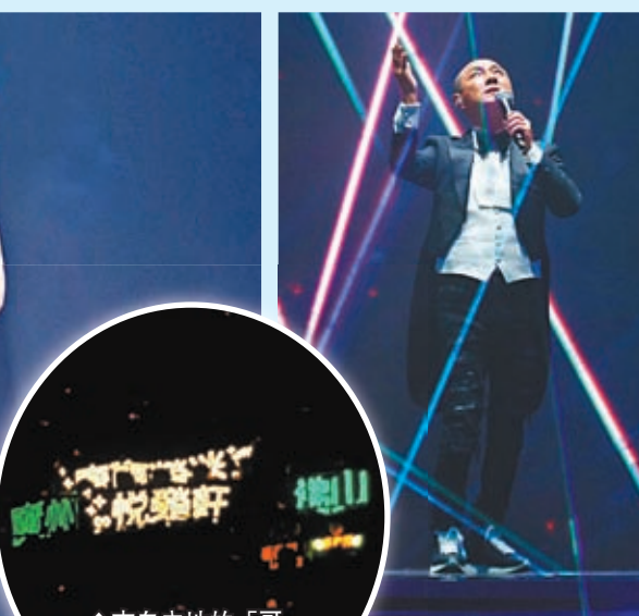
來自內地的「哥」迷攜燈牌捧場。