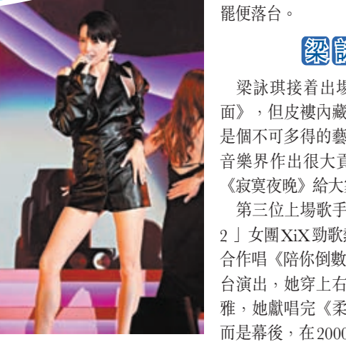
梁詠琪身穿一身黑色皮裙獻唱《側面》。