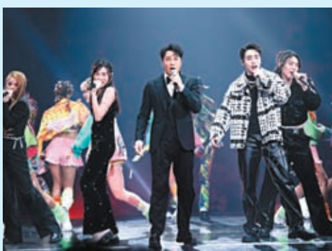
譚耀文聯同一班聲夢歌手又唱又跳。