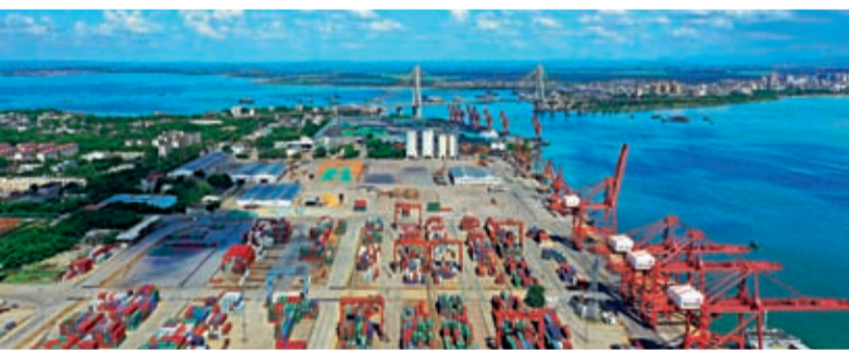
海南自由貿易港將於2025年底全島封關運作，學者指這是中國堅持實施更大範圍、更寬領域、更深層次對外開放的重要舉措。圖為洋浦經濟開發區的洋浦港。新華社

「封關」是一個海關術語，即海南全島成為一個「境內關外」區域，海南島內可以享受零關稅等優惠政策。封關運作主要是在海南與境內其他區域的分割線，按照「一線放開、二線管住」的管理模式進行。國外商品能相對自由地進入海南，但