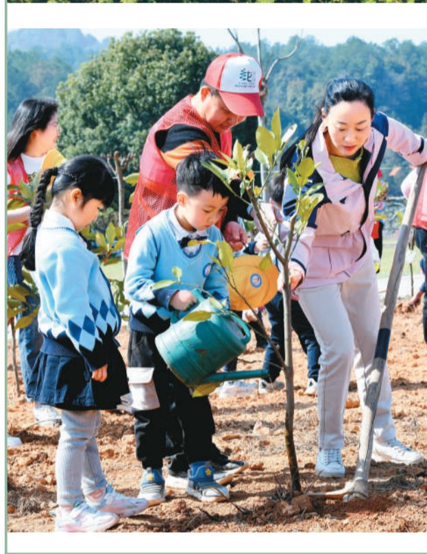
▲河北省塞罕坝国家森林公园晨景。 ▲3月12日，江西省德兴市银城幼儿园的小朋友，给刚刚种下的柚子树浇水。 ▼3月10日，在安徽省亳州市利辛县谷圩村红旗沟绿化点，退役军人和青年志愿者等，参加义务植树活动。