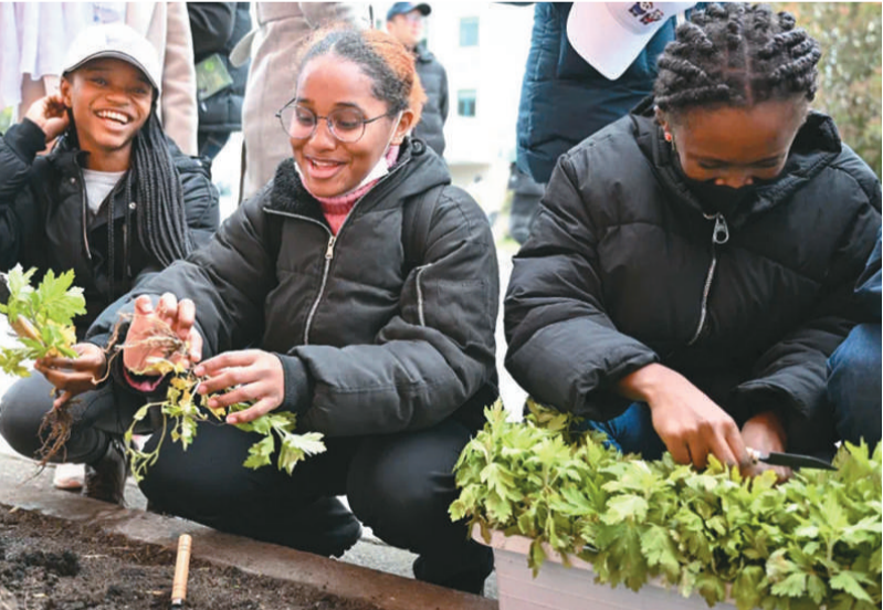
同济大学的留学生们一起种下中草药，零距离感受中医文化的奇妙之处。

蹲在苗圃边，用小铲子先松松土，挖出个小坑，再把一株艾草幼苗小心翼翼地种入土中，最后覆盖上泥土。这是在同济大学南校区一块小园圃里，来自55个国家的百余名留学生们一起种下艾草、杜仲等中草药的画面。留学生们通过种中草药，零距离感受中医文化的奇妙之处。