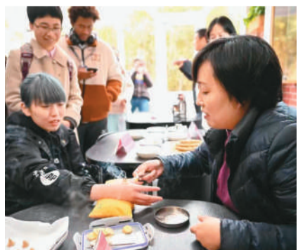
上海市中医医院的医护团队为留学生带来了艾灸等常见的中医疗法。

近年来，同济大学致力于创新留学生面向世界讲好中国故事的能力培养路径，通过“熊猫叨叨——国际学生讲中国故事”“同济大学留学生行走看中国”“留学生中国生态文明体验区”等，帮助留学生亲身感受真实、立体、全面的中国，深入感悟中华文化。