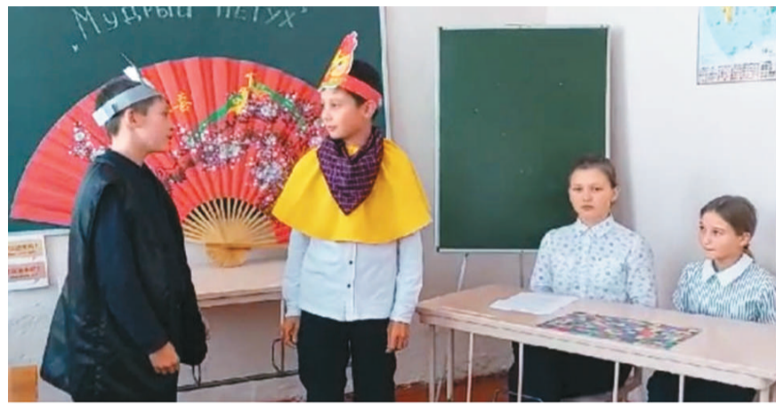
1年来，共有300名俄罗斯学生参加俄罗斯青少年中文空中课堂首期课程。图为俄罗斯学生在课堂中。