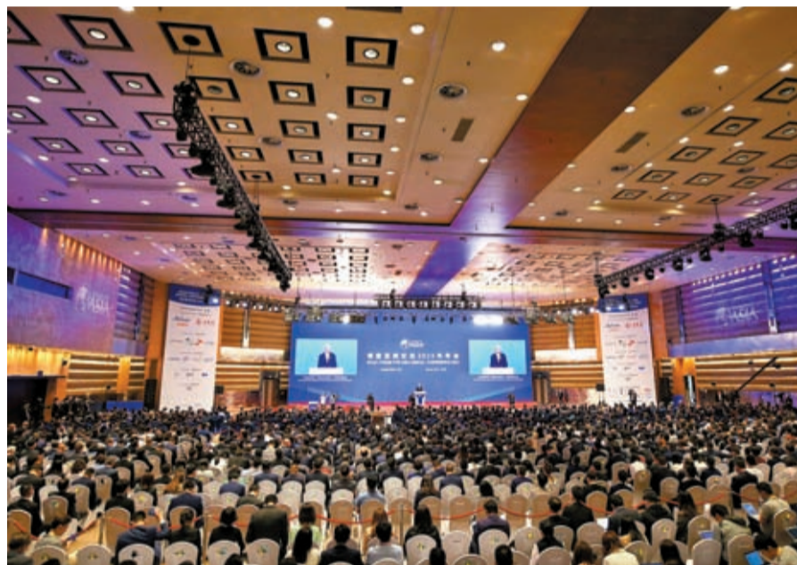
3月30日，博鰲亞洲論壇2023年年會開幕式在海南博鰲舉行。