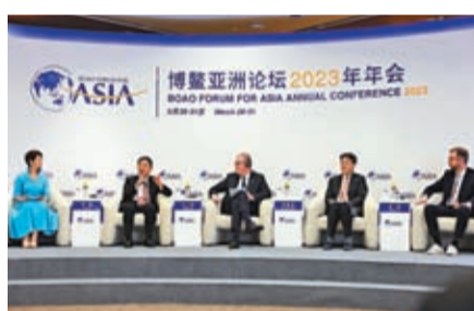
博鰲論壇「終結新冠大流行」分論壇現場。

海內外大量臨床研究證據表明，預防新冠病毒最好的辦法就是接種疫苗。博鰲論壇壇委、阿斯利康公司董事長約翰森發言時表示，在中國製造基地的幫助下，公司生產了30多億劑新冠疫苗，供給了大約180個國家，雖不盈利，但非常值得。由於新冠疫情的肆虐，讓基因測序的研究受到更多關注，不少諾貝爾獎獲得者也開始研究基因學，研究免疫療法，約翰森對於未來的態度很