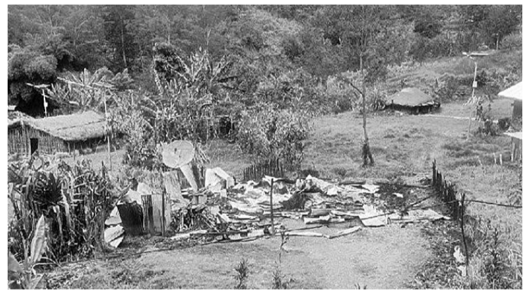
武装犯罪集团(KKB)烧毁民房

敦尼未详细说明事件的来龙去脉,他仅确定在事发之时所幸无发生人命伤亡事件。他说:“仅物质损失,如今情势已安定,保