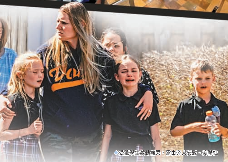
受驚學生激動痛哭，需由旁人安慰。