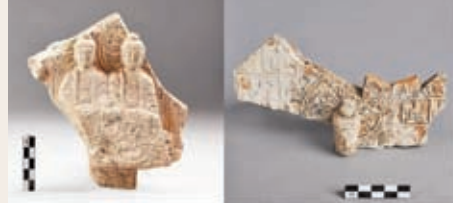
吉林琿春古城村1號寺廟址出土的佛像殘片。對完善中國南北朝隋唐時期佛教物質文化有重要意義，對實證中國統一多民族國家的形成過程、維護國家歷史安全與文化安全具有重要價值。