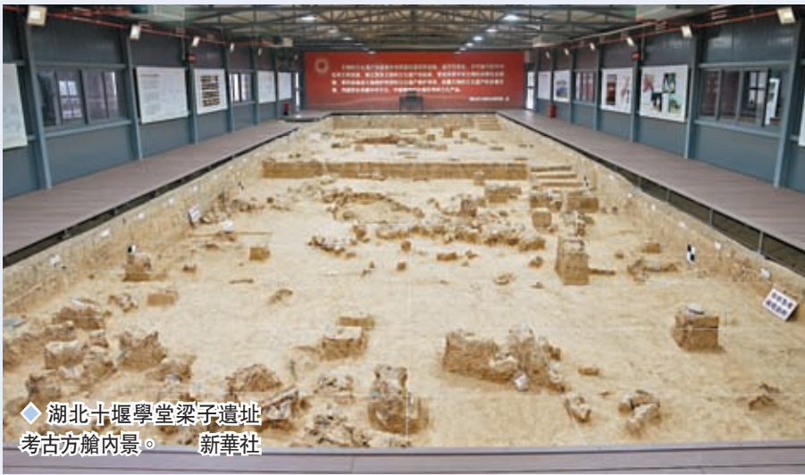
湖北十堰學堂梁子遺址考古方館內景。新華社