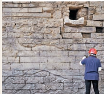
工作人員在清理河南開封州橋遺址出土的巨幅石雕祥瑞壁畫。

首次完整揭露出唐宋至清代開封城內的汴河形態，填補了中國大運河東京城段遺存的空白。州橋石壁填補了北宋藝術史的空白。