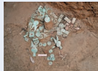
陝西旬邑西頭遺址M98墓室出土的車馬器。新華社