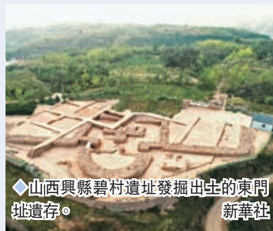
山西興縣碧村遺址發掘出土的東門址遺存。

晉陝大峽谷東岸發現的規模最大一處史前石城，是揭示天下萬國時代北方與中原之間的文化交融，展現以中原為中心的中華多元一體文明形成軌跡重要窗口。