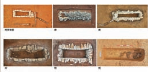
貴州貴安新區大松山墓群各時期墓葬形制。貴州地區兩晉至明代墓葬的年代標尺，是中華民族多元一體格局形成發展的生動體現。