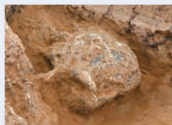
被命名為「鄖縣人3號頭骨」的古人類頭骨化石。