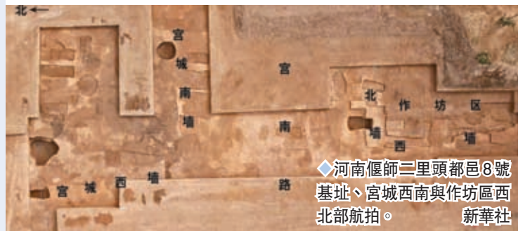
河南偃師二里頭都邑8號基址、宮城西南與作坊區西北側航拍。新華社