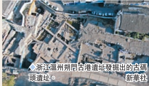
重現宋元時期溫州港的繁華景象，是中國城市考古、港口考古的重大收穫。是海上絲綢之路重要節點，龍泉青瓷外銷從這裏啟航。