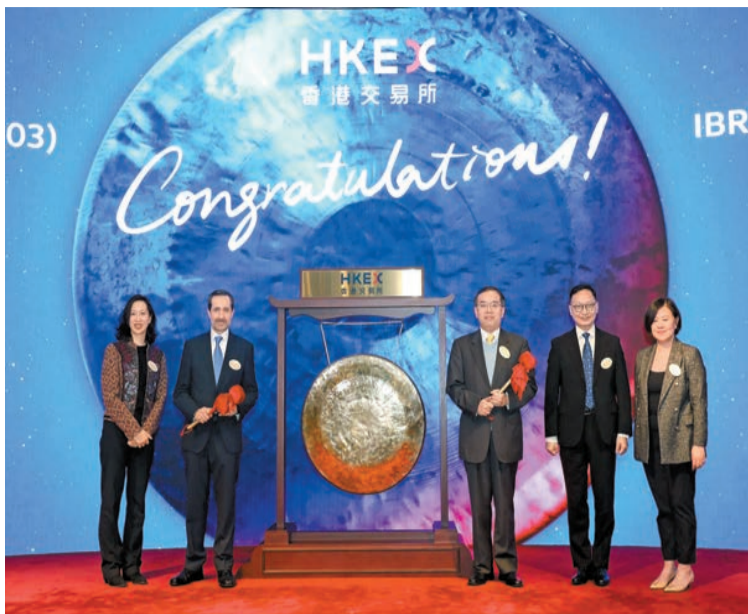
港交所昨日進行了敲鐘儀式，以誌保險相連證券首度上市。

【香港商報訊】記者蘇尚報：世界銀行旗下國際復興開發銀行（IBRD）發行的世界銀行巨災（智利地震）債券，昨日在港交所（388）掛牌，為本港第一隻上市的巨災債券。財政司司長陳茂波對此表示歡迎，強調本港正銳意發展成為國際領先的風險管理中心。