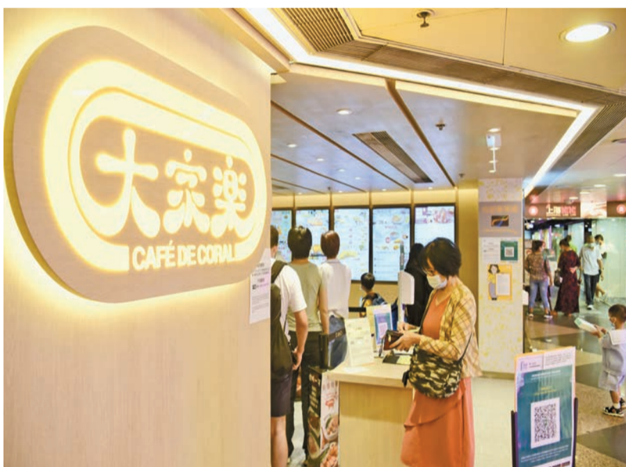
大家樂集團未來將於旅遊區開設小型門店。