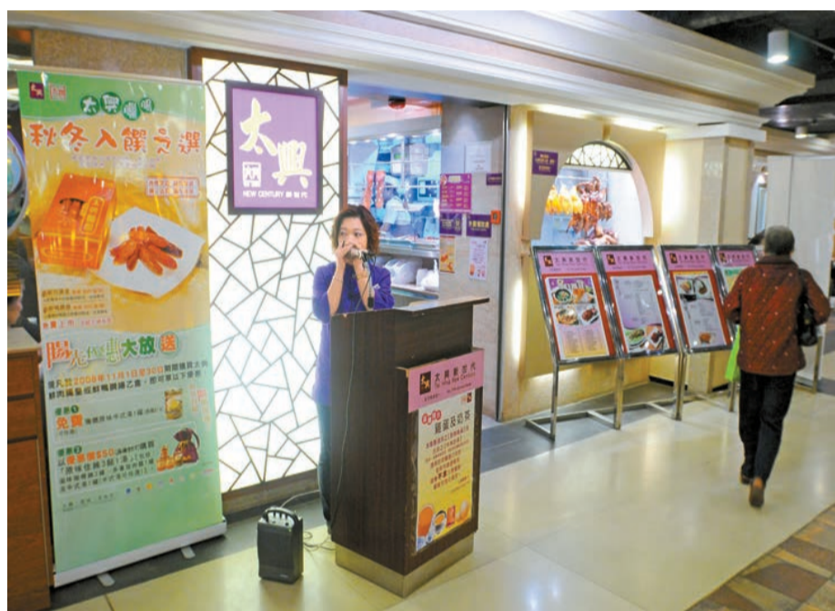
太興將增加在香港機場的分店。