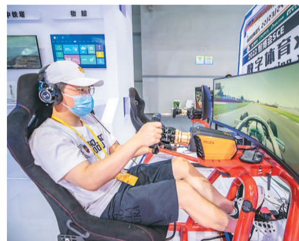
工作人员在演示F1电竞模拟器。