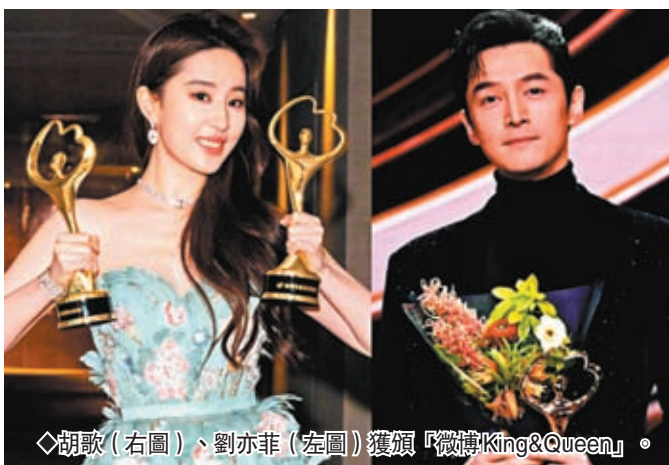
◀胡歌（右圖）、劉亦菲（左圖）獲頒「微博King&Queen」。

麥大傑1957年出生於越南，幼時父親為了工作將他安置在附近戲院，下班後才接他回家，也啟蒙了麥大傑對於電影的熱愛。越戰期間，他隨家人移居香港，1979年來到台灣攻讀師大美術系，畢業後一度回港做廣告與美術設計，直到1984年台灣中影開拍電影《阿福的禮物》，麥大傑應邀執導香港篇，才開啟了他的電影導演之路。後來，麥大傑以聯考重考生為題材的諷刺喜劇《國四英雄傳》，因劇本批判教育制度，差點被禁映。不過這部電影獲得學生族群喜愛，除了音樂、剪接方式搶眼外，也