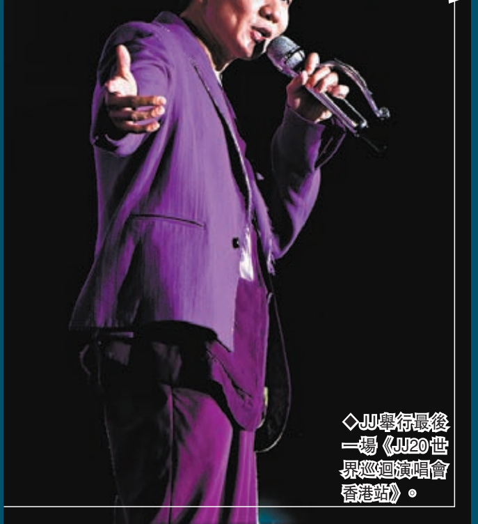
◀JJ舉行最後一場《JJ20世界巡迴演唱會香港站》。