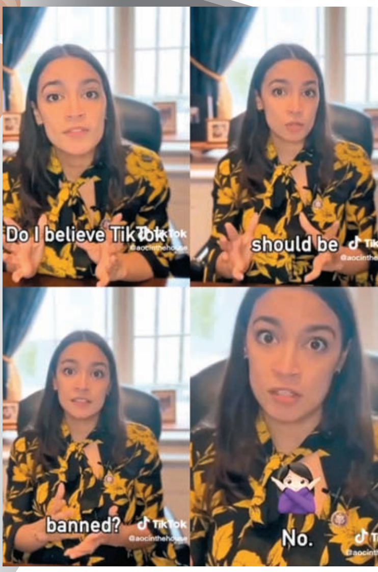
奧卡西奧-科爾特斯發布其第一條 TikTok 視頻發聲。

香港文匯報訊 美國國會議員計劃封殺影音分享平台 TikTok，引發各界反對聲音，多名國會議員發聲，反對針對 TikTok 實施禁令，強調應採取切實措施保障美國民眾的數據安全，而非一刀切頒布禁令，批評此舉是本末倒置。