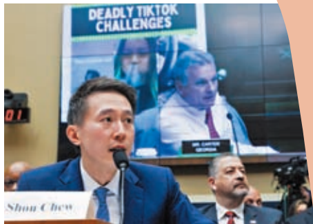
TikTok CEO 周受資早前在聽證會上作供。

追隨者，並透過 TikTok 建立了自己的職業，與一些零售企業合作，利用該平台發放影片賺取收入，一旦無法使用 TikTok，將很難在其他平台吸引如此多觀眾，「到時可能被迫返回辦公室打工。」