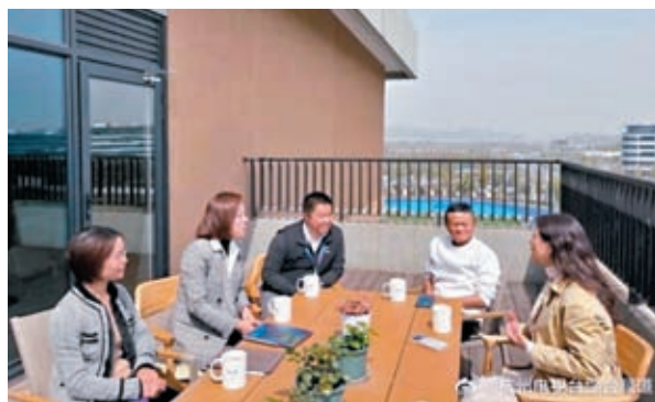
◆ 馬雲27日在杭州市參觀由他創辦的雲谷學校。

對於馬雲回鄉，前《環球時報》主編胡錫進27日亦發微博稱：「今天杭州的氣溫看來和北京差