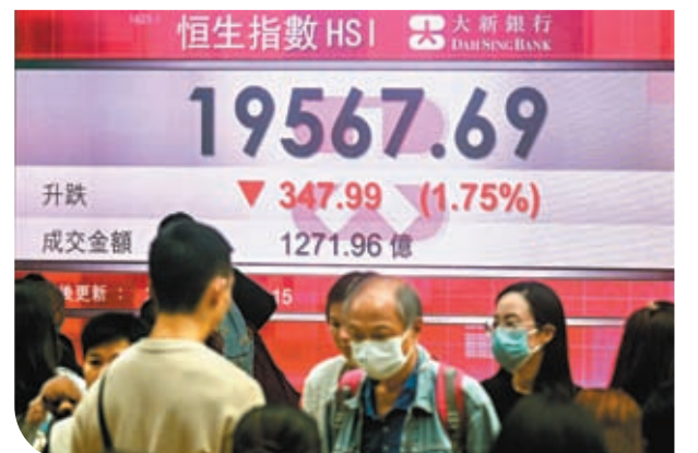
◆ 港股連跌兩日，累挫481點。

煤炭股業績後表現各異，兗礦去年多賺近八成，派特別息及紅股，AH股同升一成。神華去年多賺42%，但股價卻跌5.3%。