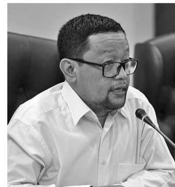
伊联中央理事会执行主席伊斯法

【本报讯】3月26日，伊联(NU)中央理事会执行主席伊斯法·阿比达尔·阿齐兹(Ishfah Abidal Aziz)声称，伊联不想被拖入实际政治领域，而推选总统候选人阿尼斯的副座人选。这是因为伊联无权讨论实际政治。伊联本质上是一个宗教社会组织。我们没有权力支持、推荐、批准副总统人选。那不是伊联的权限，实际政治完全是政党的领域。伊斯法指出，出于这个原因，呼吁各政党聚集在一起讨论此事，千万别牵涉伊联人物或成员。现在有很多政党，有从业党、民族民主党、印尼斗争民主党、团结建设党、民族复兴党。这是政党的问题，不要拉伊联下水。伊联对任何想要讨论国家和社会问题的人实行开放政策，但是如果涉及副总统问题，那就用最佳方式去实行。但是，伊斯法却没有详细说明所谓的最佳方法会是什么样子。伊斯法表示，这取决于想怎样做，努力去做，就是这样。伊斯法最后表示，不希望伊联被迫祝福潜在成为阿尼斯的副座的人物。所以，我再讲一遍，不要强迫伊联一定要有祝福什么的。这不是伊联讨论的话题；不是那个地方，伊联是谈论社会宗教，而不是谈论政治。