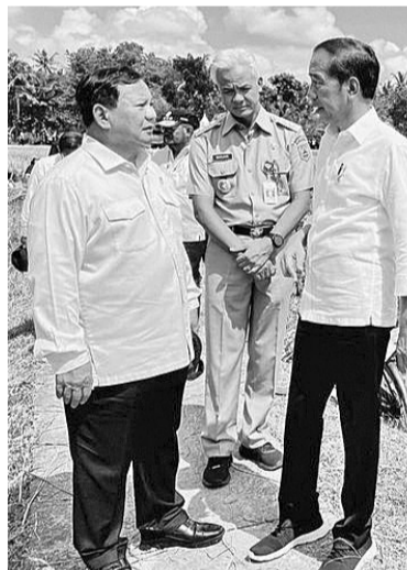
左起：普拉波沃、甘贾尔、佐科维

【本报讯】Saiful Mujani Research dan Consulting (SMRC)调查机构由2023年3月3日至11日的调查报告显示，公众评估佐科维总统政府的政治经济表现出色，据称可能会支持甘贾尔在2024年成为总统候选人。