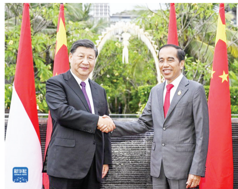
2022年11月16日晚,国家主席习近平在巴厘岛同印度尼西亚总统佐科举行会谈。

10年来,人类命运共同体理念持续深入人心,先后写入《中国共产党章程》《中华人民共和国宪法》,也陆续写入联合国、上海合