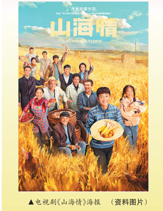
▲电视剧《山海情》海报 (资料图片)

142亩土地上播种、灌溉、施肥、收获。节目借鉴“慢综艺”的制作方法，将综艺和劳动、劳作相结合，在劳作中展现乡村之美，诠释“藏粮于地、藏粮于技”的现实内涵。《山水间的家》采取纪录片的拍摄手法，精心选取了在文旅融合发展层面具有代表性的24个特色乡村，以平易而亲和的“探访”视角与当地村民进行深入交流，通过一个个有温度、接地气的人物故事，折射出中国农村在乡村振兴政策背景下收获的喜人成果。