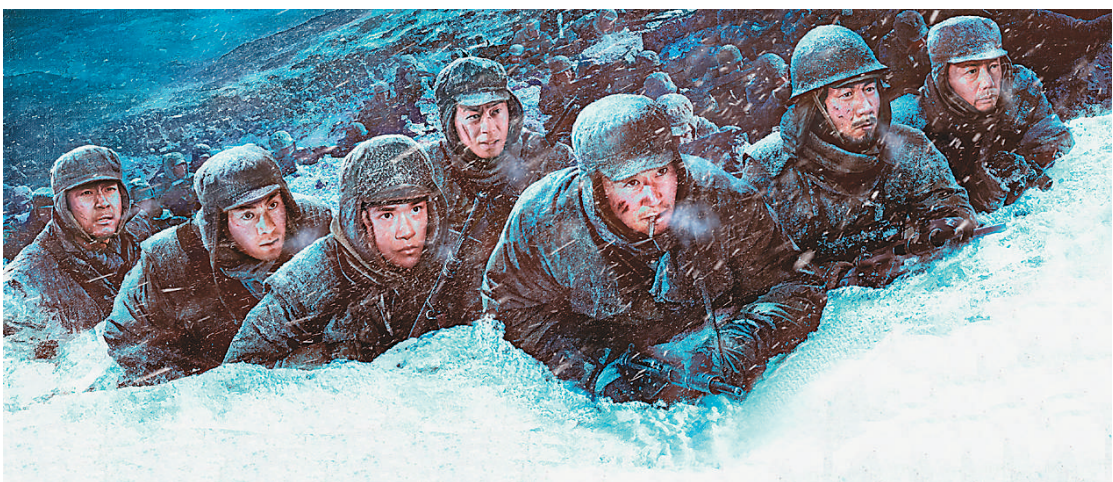
▲电影《长津湖》海报 (资料图片)